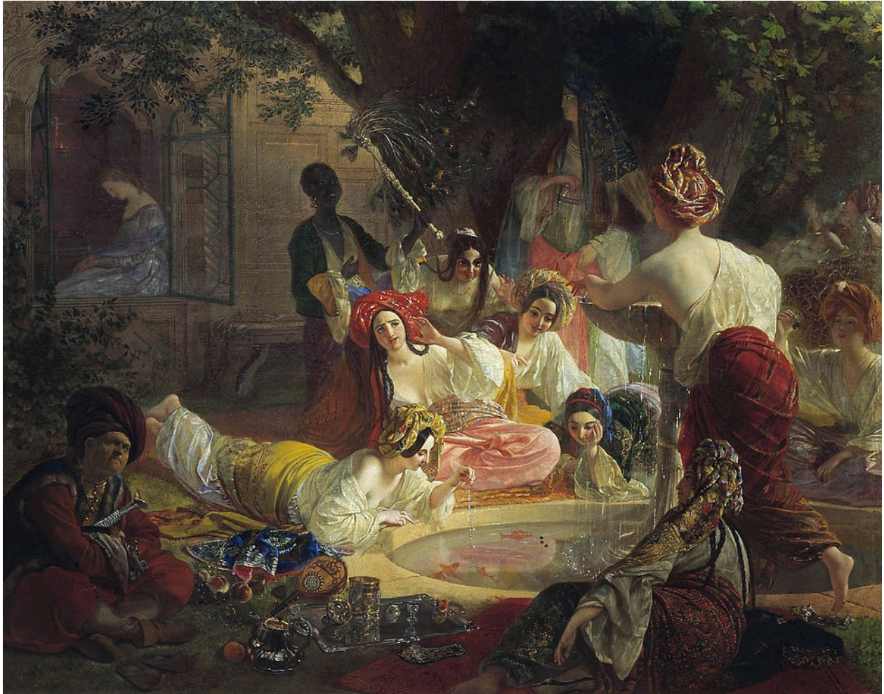
“Fontanna Bachczysaraju” Karl Briułow (1799-1852), olej na płótnie 1849 r. Muzeum Sztuk Pięknych Im. Puszkona w Moskwie